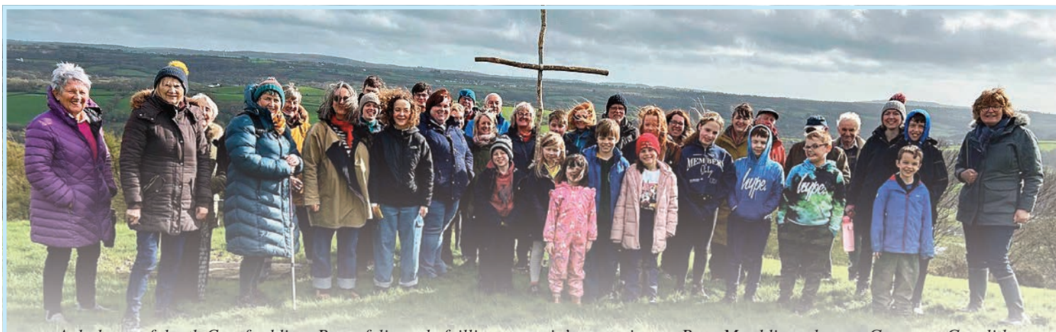
Aelodau o ofalaeth Caerfyrddin a Bancyfelin a chyfeillion yn cario'r groes i gopa Bryn Myrddin ar bnawn Gwener y Groglith