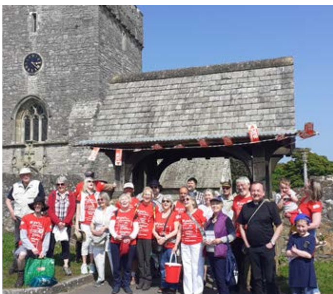
Bydd eglwysi Porthcawl yn cynnal Pererindod Porthcawl, neu 'holy hike' eto eleni – diwrnod o gerdded o gapel i gapel, gyda llawer o gymdeithasu, myfyrto a hwyf ar hyd y ffordd!