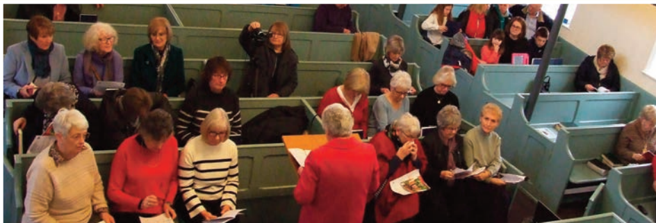
Aelodau Cwrdd Merched, Bethlehem, Gwaelod-y-garth, fu'n cynnal yr oedfa Sul Gweddi'r Byd eto eleni